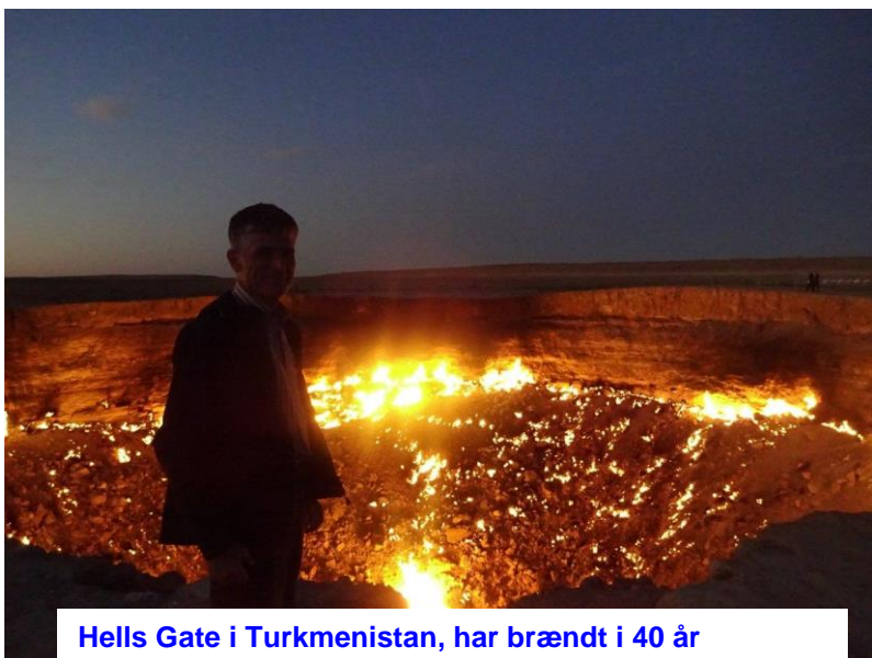
Hells Gate i Turkmenistan, har brændt i 40 år

Har du/l lyst til at se billeder, samt høre om rejsen i det hele taget – så mød op